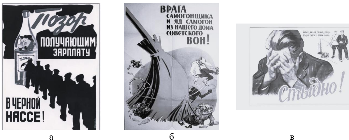
Рисунок 1 – Советские плакаты: а) «Позор получающим зарплату в черной кассе!», б) «Врага самогонщика и яд самогон...», в) «Стыдно!»

Плакаты также акцентировали внимание на социальных последствиях пьянства, таких как ухудшение экономического положения семьи, нарушение общественного порядка и безопасности. Они призывали к ответственному отношению к употреблению алкоголя и предостерегали от его вредных последствий (рисунок 1, в) [3].