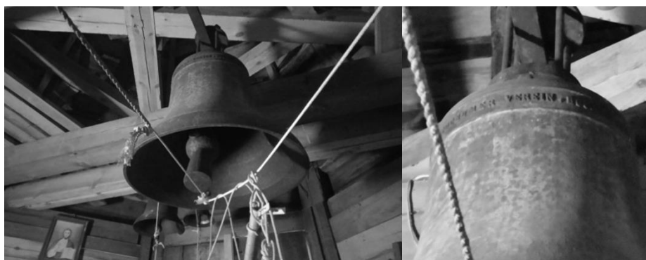
Фото 2 – Лютеранский колокол на колокольне церкви Св. Луки в г. п. Домачево (октябрь 2023)

В октябре 2023 г. был проведен осмотр сохранившегося колокола на колокольне православной церкви Св. Луки в г. п. Домачево (фото 2).