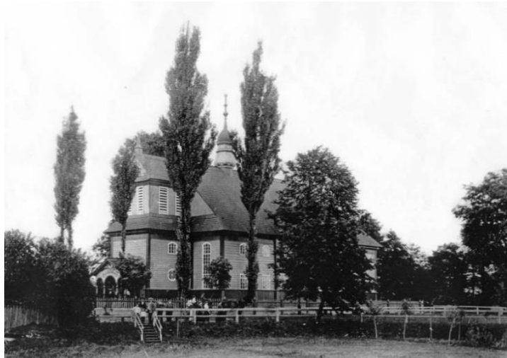
Фото 1 – Нейдорф-Нейбровская кирха Св. Троицы в начале XX в.

Новое здание кирхи было возведено в 1778 г. и освящено в честь Св. Троицы 15 ноября того же года [5]. К сожалению, невозможно сказать, был ли у кирхи свой колокол в период с конца XVIII в. по начало XX в. На данный момент не найдено соответствующих источников, указывающих на это. Используя фотографию начала XX в. (фото 1), можно сделать предположение, что в западной части храма над входом располагалась колокольня.