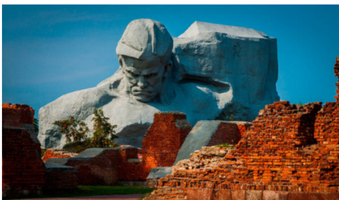
Посещение Мемориального комплекса «Брестская крепость- герой»;