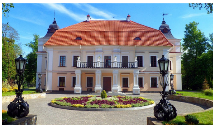
Посещение Усадьбы Немцевичей (д. Скоки)