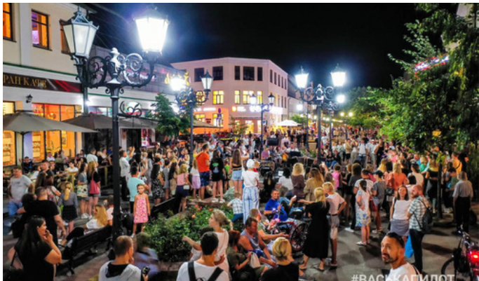
Экскурсии по г. Бресту