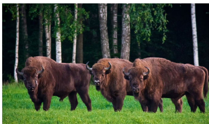
Экскурсия в Национальный парк «Беловежская пуща»