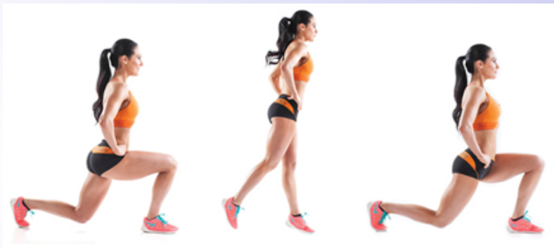
Выпад с продвижением вперед

Все упражнения вы делаете по самочувствию, то есть, если вдруг вам нельзя делать какое-либо упражнение или тяжело выполнить его до конца, тогда уменьшите количество упражнений до комфортного состояния «легкой усталости».